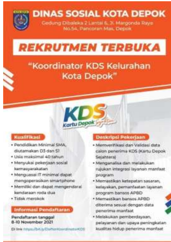
Gambar 3. Kualifikasi Koordinator Pelaksana