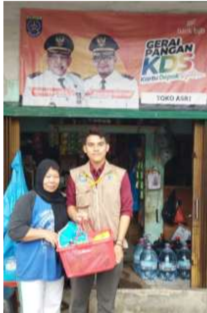
Gambar 4. Proses Distribusi Bantuan