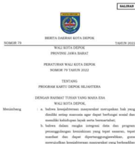
Gambar 4. Peraturan Wali Kota Depok Nomor 79 Tahun 2022 tentang Program KDS

Selanjutnya pada Kelurahan Tanah Baru telah memiliki pemahaman yang baik terhadap alur pelaksanaan Kebijakan Jaminan Ketersediaan Pangan Kota melalui Program Kartu Depok Sejahtera. Hal ini tercermin dari adanya mekanisme pelaksanaan yang jelas dan terstruktur, dimulai dari proses pendataan calon penerima manfaat, dilanjutkan dengan tahapan verifikasi dan validasi.