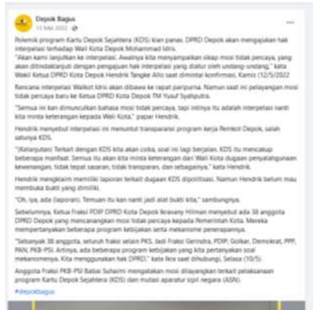
Gambar 2. Komplain Masyarakat