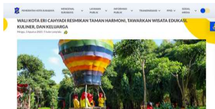
Gambar 1. Dokumen Berita surabaya.go.id

Salah satu upaya pengelolaan RTH berbasis kolaborasi di kota Surabaya adalah Pembangunan Taman Harmoni keputih, transformasi lahan bekas pencemaran dan konflik sosial (Liputan6, 2001). Sebagaimana dapat dilihat pada gambar 1.1 berikut.