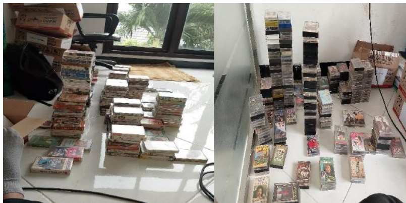
Gambar 2. Tahap Pemeriksaan Arsip Koleksi Kaset Pita

Berdasarkan pada hasil wawancara, maka dilakukan observasi atas arsip koleksi kaset pita, sebagai upaya untuk melengkapi hasil wawancara dengan melakukan pemeriksaan, untuk melakukan pemilahan dan pengelompokan, dengan bukti sebagai berikut: