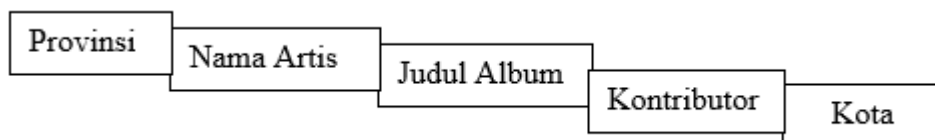
Gambar 3. Rencana Penyusunan Indeks

Berdasarkan pada hasil wawancara di atas, serta sesuai dengan observasi awal yang telah dilakukan, maka penyusunan indeks menggunakan sistem wilayah/geografis, yaitu disusun secara sistematis mulai dari identifikasi asal daerah atau provinsi, kemudian penyanyi atau artisnya, dilanjutkan judul album yang tertera pada kaset pita. Setelah deskripsi kaset pita selesai, dilanjutkan pada deskripsi asal atau darimana kaset pita tersebut diperoleh, yaitu siapa kontributornya dan berasal dari kota mana. Rancangan penyusunan indeks dilakukan sebagai berikut: