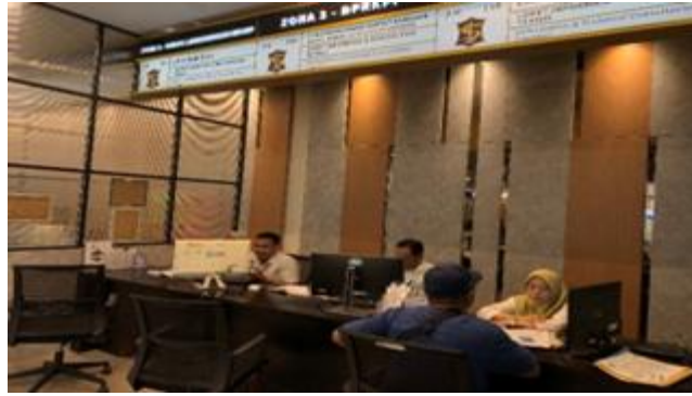
Gambar 1. Pelayanan Publik di Siola Mall.

Analisis Dampak Lalu Lintas merupakan kajian yang membahas dampak lalu lintas yang timbul akibat pembangunan kegiatan atau usaha tertentu, dengan hasil kajian tersebut dituangkan dalam dokumen hasil analisis lalu lintas. Pembangunan kegiatan atau usaha ini dapat menyebabkan perubahan tata guna lahan yang berdampak pada lalu lintas di sekitarnya. Dalam konteks ini, Andalalin yang diterapkan di Siola digunakan sebagai alat untuk menentukan kategori bangkitan lalu lintas, yang selanjutnya menjadi dasar dalam menentukan jumlah dan luas pembangunan infrastruktur yang diperlukan. Dengan demikian, Andalalin berfungsi sebagai instrumen penting untuk menghitung besarnya jumlah bangkitan perjalanan baru yang memerlukan rekayasa dan manajemen lalu lintas guna menjaga kelancaran dan keamanan sistem transportasi (Sumajouw dkk., 2013).