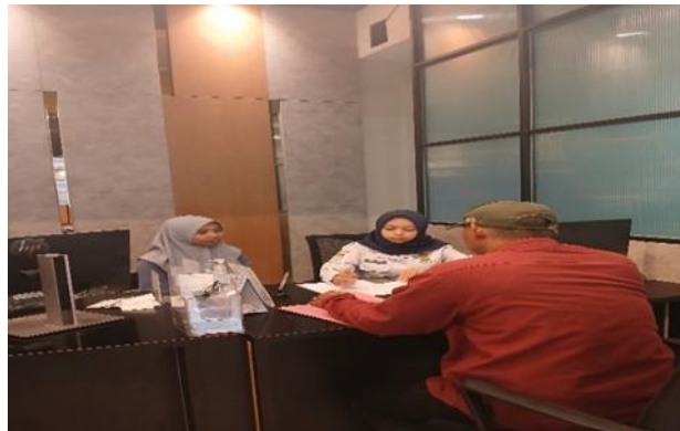
Gambar 3. Aspek Pelayanan Publik.

komunikasi yang diterapkan mencakup sikap sopan dan ramah dalam memberikan pelayanan, penyampaian informasi yang akurat dan lengkap, serta penanganan keluhan atau pertanyaan secara cepat dan tepat.