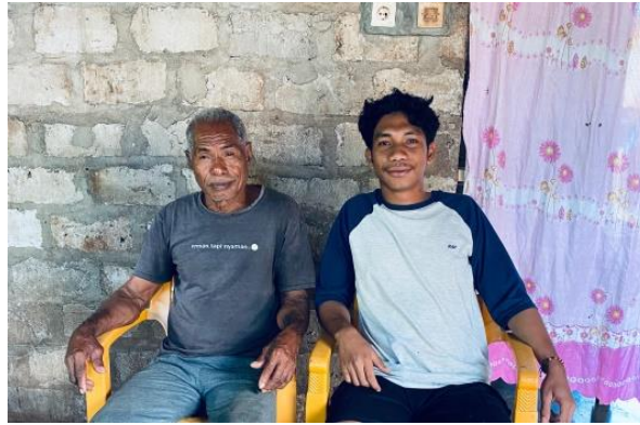
Gambar 2. Proses Wawancara dan dokumentasi bersama salah satu Narasumber

Pada proses berikutnya merupakan tahapan editing video. Pada tahap ini terdapat beberapa segmentasi video yang bertujuan untuk meringkaskan informasi yang relevan untuk kebutuhan informasi. Terdapat beberapa informasi yang tidak dibutuhkan sehingga segmentasi video perlu dilakukan untuk kebutuhan informasi yang relevan. Pengeditan menggunakan aplikasi Capcut berdasarkan story line yang telah dibuat.