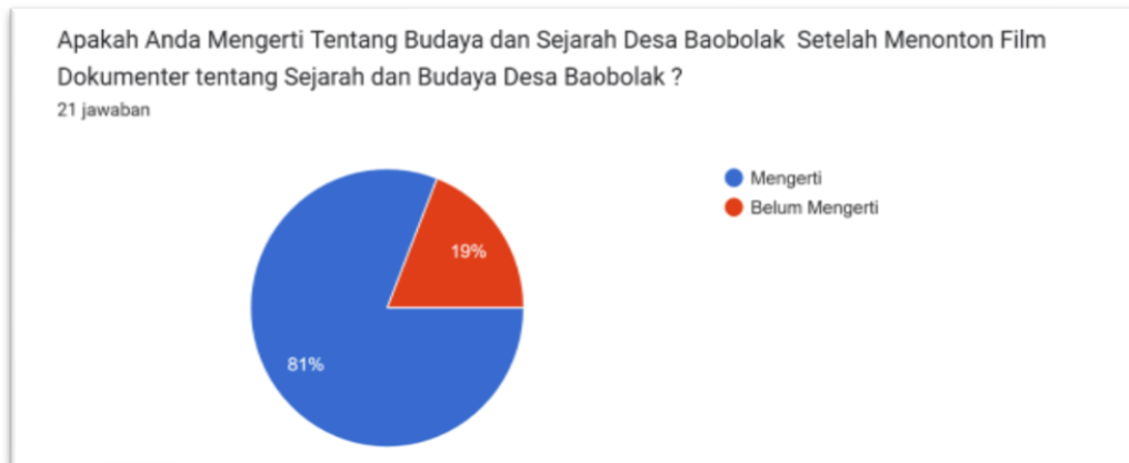
Diagram 1. Hasil Survei Google Form

Berdasarkan data diagram tersebut, rasio generasi muda yang mengalami peningkatan pemahaman mencapai angka 81%. Hal ini menunjukkan bahwa upaya pelestarian budaya melalui dokumentasi budaya merupakan salah satu alternative yang digunakan untuk menjaga kelestarian budaya untuk generasi berikutnya. Hal ini sejalan yang dikatakan dalam (Nurhidayah, Khadijah, & CMS, 2024) bahwa untuk menyuntik pemahaman budaya kepada masyarakat perlu adanya Culture experience atau pengalaman budaya adalah proses terlibat langsung dalam pelaksanaan budaya itu sendiri dan Culture Knowledge atau pengetahuan budaya berkaitan dengan penyediaan sumber informasi tentang suatu budaya. Aspek penyediaan informasi menjadi penting karena sejalan dengan perkembangan zaman yang menjadikan informasi sebagai sebuah sarana dalam memperoleh pengetahuan.