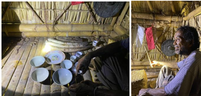
Gambar 1. Proses Observasi di Rumah Adat Desa Baobolak

Dalam proses dokumentasi, setiap metode yang digunakan dijalankan berdasarkan prosedur yang telah ditetapkan sedari awal. Pada proses pertama, observasi dilakukan guna mencari data sekunder yang berhubungan dengan data primer. Observasi dilakukan di rumah adat desa Baobolak bersama salah satu tetua adat yakni Bapak Theo Tobi pada tanggal 04 Mei 2025. Dalam proses observasi, pengenalan struktur pranata sosial dan hirarki adat dijelaskan secara naratif oleh narasumber berdasarkan ketentuan praktik budaya yang dilakukan di daerah setempat.