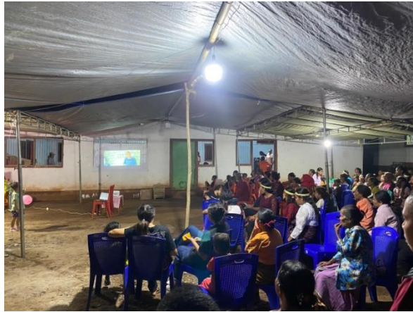
Gambar 4. Nonton Film dokumenter Berama masyarakat

Setelah semua proses tersebut berjalan, survei menggunakan google form dilakukan untuk mengetahui perubahan pemahaman masyarakat terkhususnya kaum muda tentang sejarah dan praktik budaya Desa Baobolak, Kecamatan Nagawutung, Kabupaten Lembata.