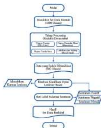
Gambar 2. Flawchart Alur Pengolahan Data.