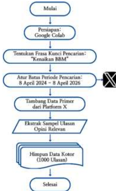
Gambar 1. Flawchart Alur Pengumpulan Data.

Data primer ditambang langsung dari platform X memfokuskan pencarian pada frasa “kenaikan BBM”. Ekstraksi sampel dibatasi pada periode 8 April 2024 hingga 8 April 2026, yang berhasil menghimpun 500 ulasan opini pengguna yang relevan.