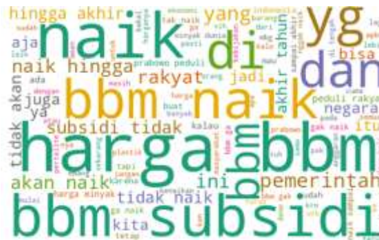
Gambar 5. Visualisasi Word Cloud Berdasarkan Frekuensi Kata.